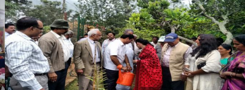
ಇಂದು ನೀವು ಮರ ಕಡಿದರಲಿ, ನಾಳೆ ನಮ್ಮ ಬಾಳನ್ನಲಿ ಸುಡುತ್ತದೆ.