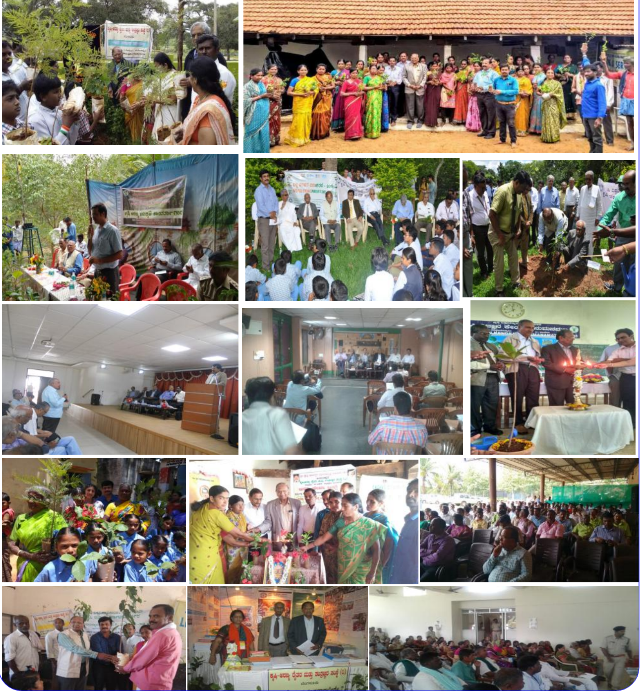
ಇರುವುದೊಂದೇ ನಮಗೆ ಭೂಸ್ವರ್ಗ ಪರಿವರ್ತಿಸದಿರಿ ಸ್ವಾರ್ಥತೆಯಲ್ಲಿ ಹಾಳು ನರಕ.