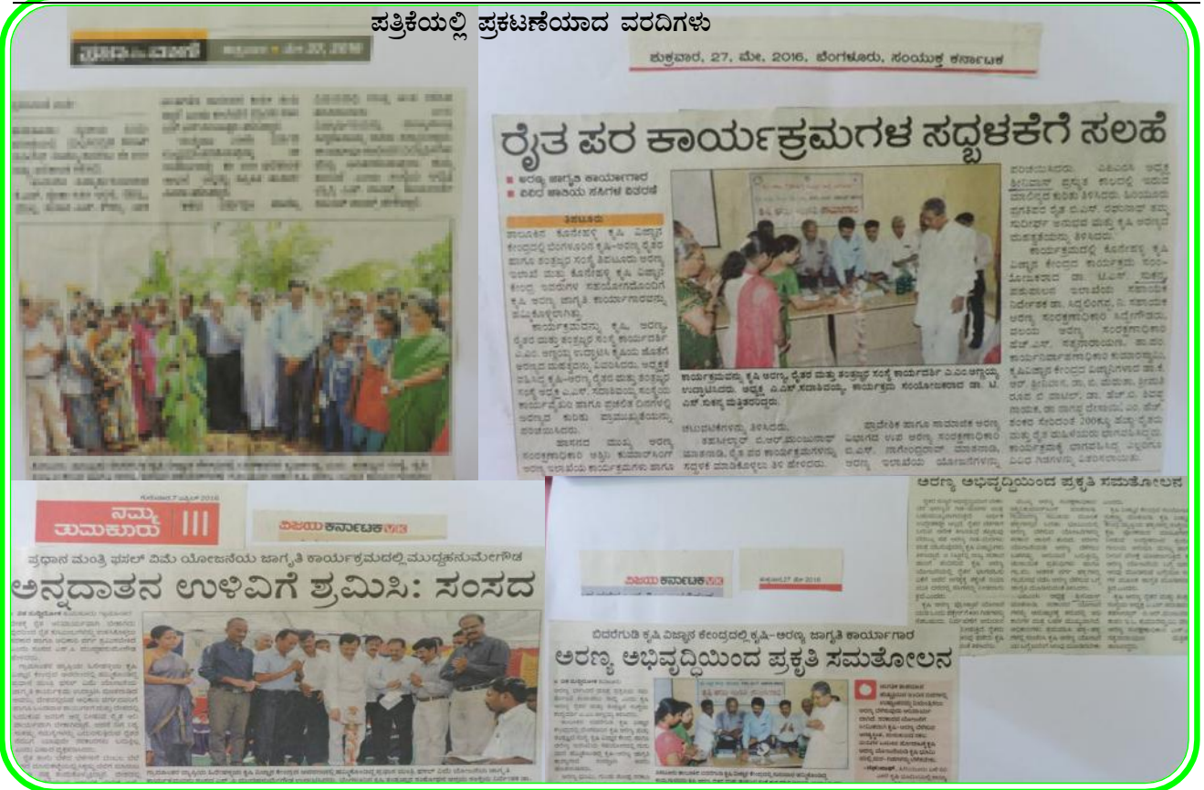
ಅರಣ್ಯ ಸಂಪತ್ತು ರಕ್ಷಿಸೋಣ, ನಮ್ಮದಿಯ ಜೀವನ ಸಾಗಿಸೋಣ.